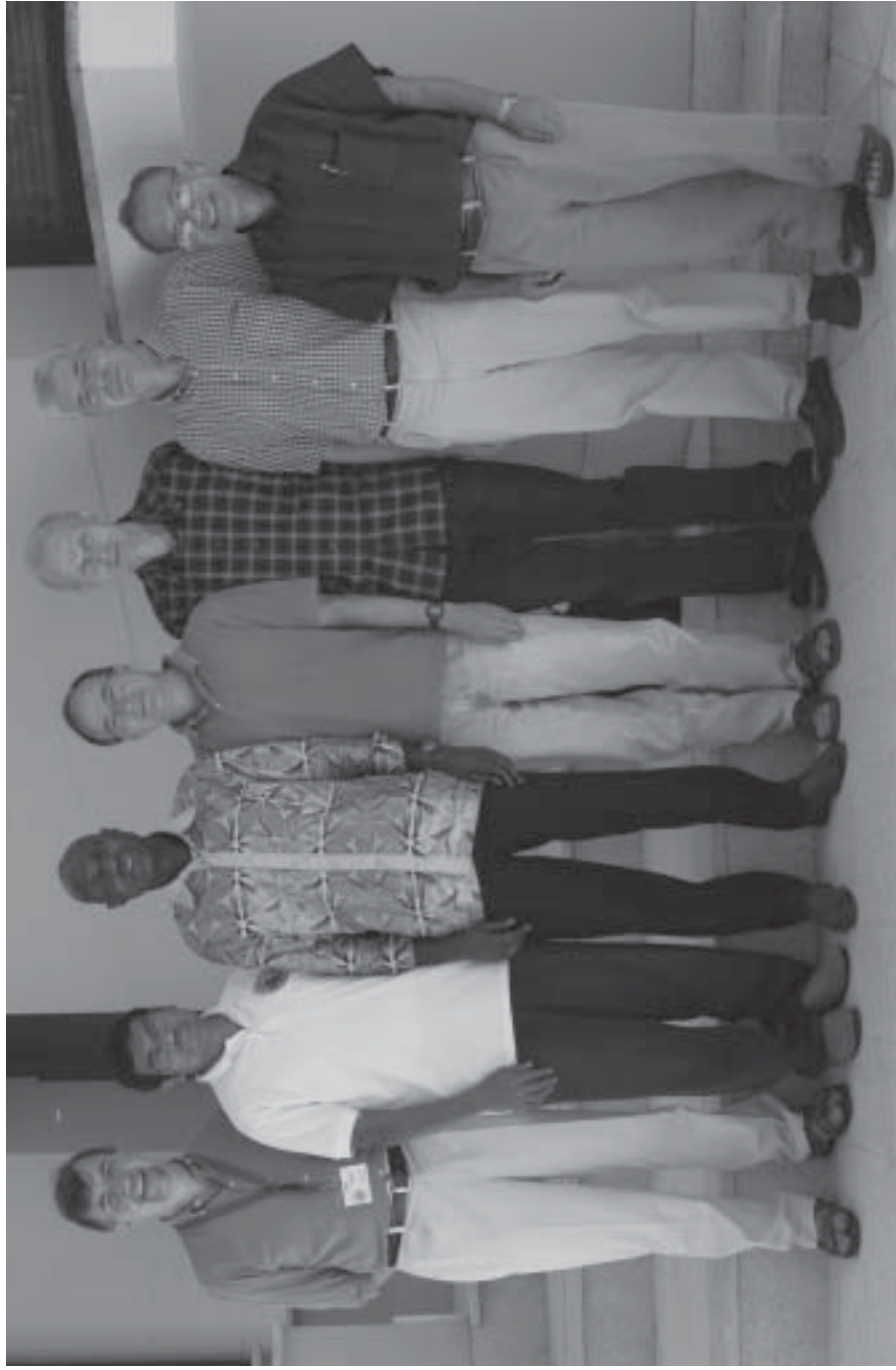
Superior Jendral dan Dewan (2012-2018)