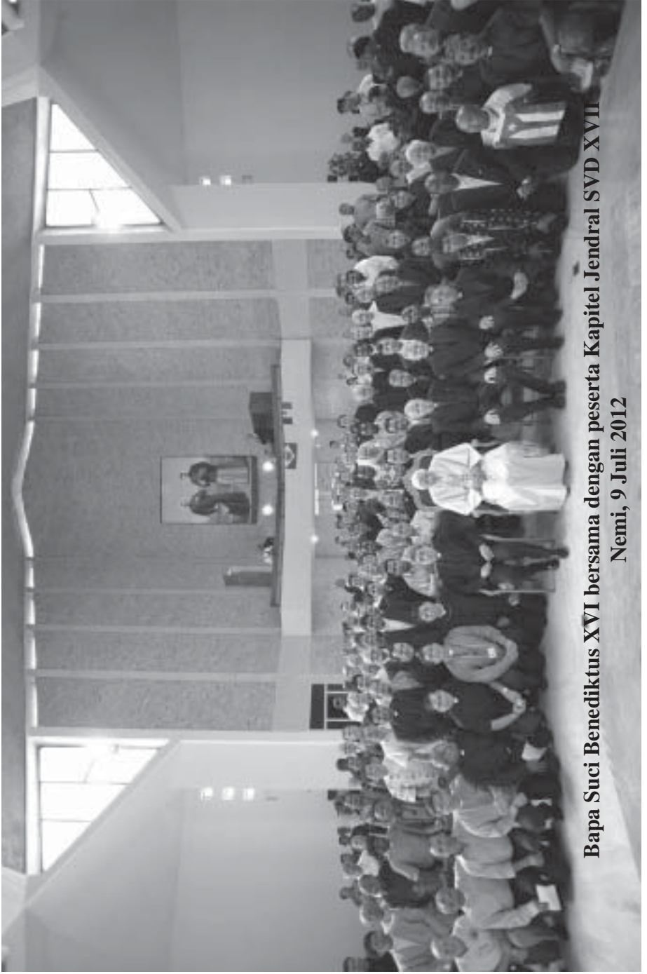
Bapa Suci Benediktus XVI bersama dengan peserta Kapitel Jendral SVD XVII Nemi, 9 Juli 2012